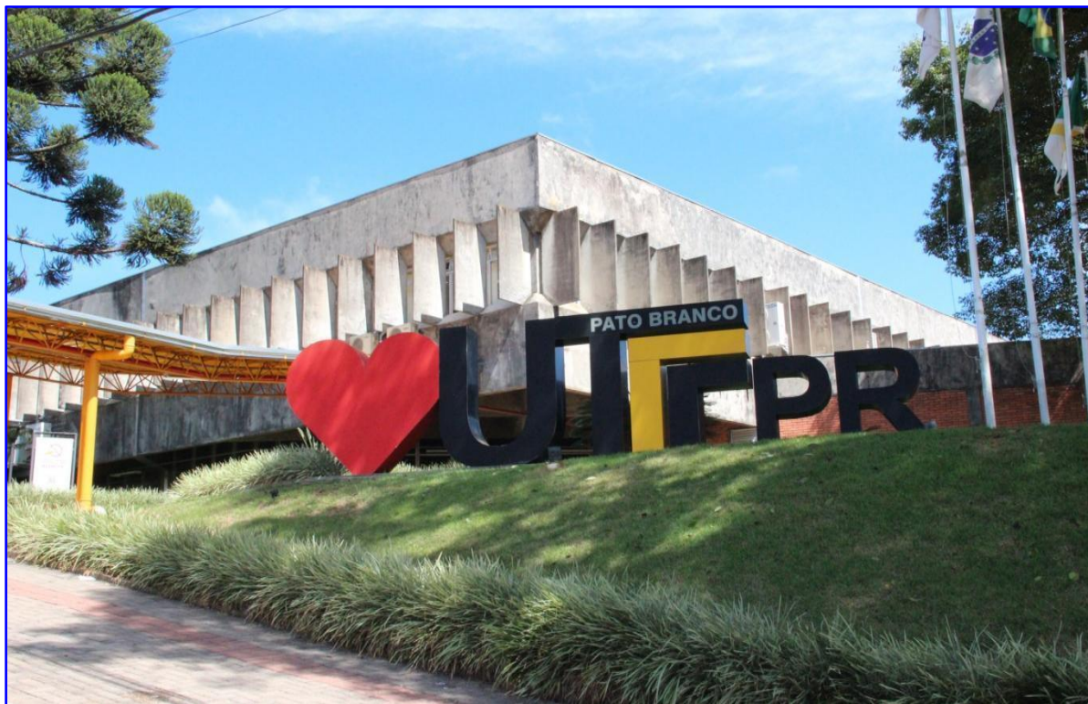
Figura 5 - Fotografia da entrada do bloco administrativo do Campus Pato Branco da UTFPR