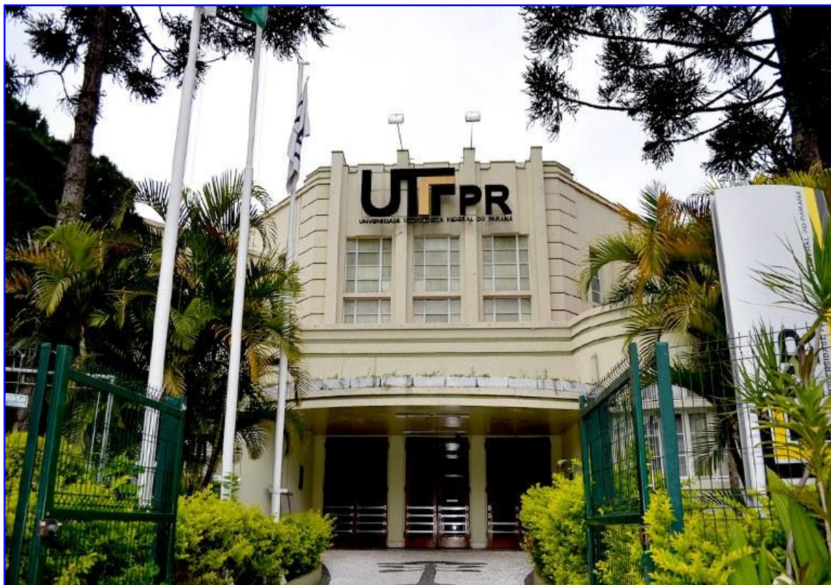
Figura 2 - Fachada atual do Campus sede da Reitoria da UTFPR

No ano de 1935 mudou-se para a sede na Avenida Sete de Setembro, esquina com a Rua Desembargador Westphalen, lugar que permanece até os dias atuais como sede do Campus Curitiba e da Reitoria, conforme fotografia ilustrada pela Figura 2.