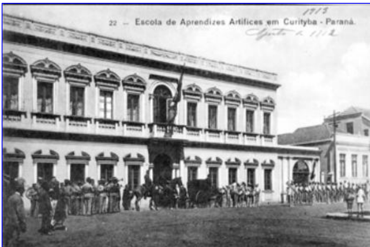
Figura 1 – Escola de Aprendizes Artífices em Curitiba, 1912