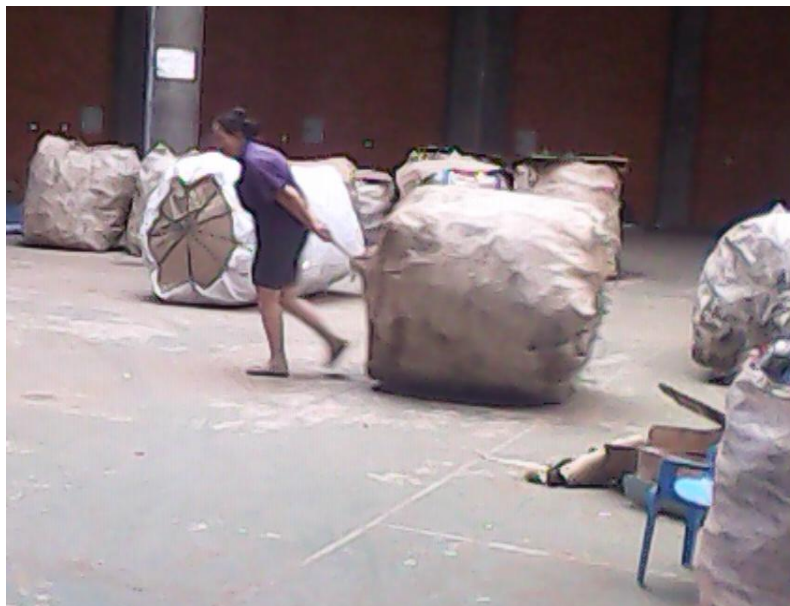
Figura 14 – Bag's sendo arrastados pelos trabalhadores

Para pesagem do material, os bag's são pendurados em balança suspensa, conforme ilustrado na Figura 15 e Figura 16. Posterior à pesagem, os bag's são carregados no caminhão conforme ilustrado na Figura 17 e Figura 18.