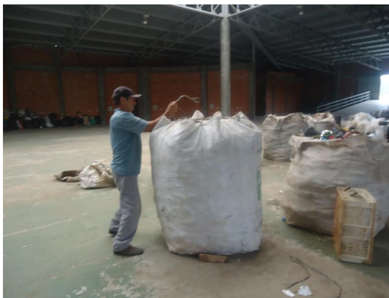
Figura 11 – Trabalhador realizando o ensacamento do material segregado

Os resíduos segregados são ensacados e arrastados pelos trabalhadores até o lado esquerdo do barracão, onde ficam armazenados até a venda do material. Da Figura 11 a Figura 14 pode-se visualizar imagens destas etapas do trabalho.