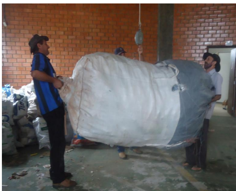
Figura 15 – Associados pendurando o Bag na balança suspensa para fazer a pesagem

Para pesagem do material, os bag's são pendurados em balança suspensa, conforme ilustrado na Figura 15 e Figura 16. Posterior à pesagem, os bag's são carregados no caminhão conforme ilustrado na Figura 17 e Figura 18.