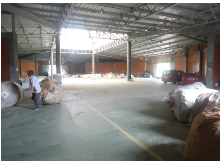
Figura 2 – Vista interna do barracão utilizado pela ACMRBN

O município de Balsa Nova possui aterro sanitário próprio para destinação final dos seus resíduos sólidos, no qual existe um barracão que será reformado e cedido definitivamente para os trabalhos da associação.