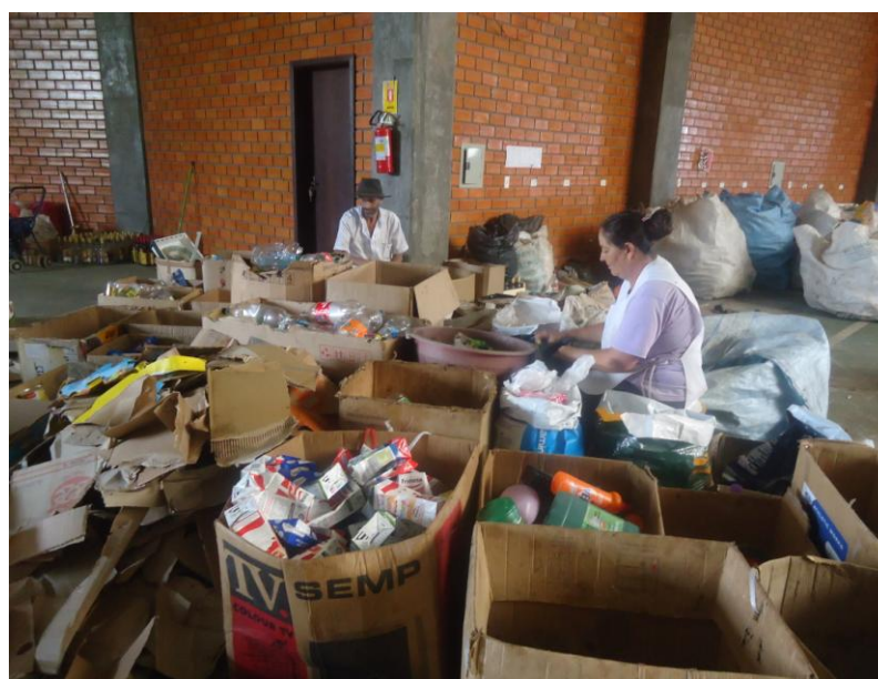
Figura 8 – Associados realizando a triagem dos resíduos