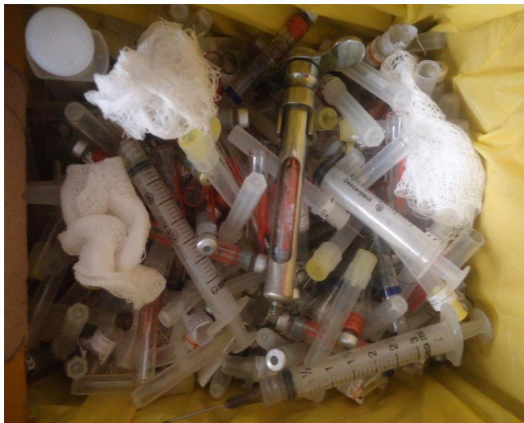
Figura 10 – Resíduo hospitalar destinado incorretamente na coleta de materiais recicláveis

De acordo com a NR 15, que trata de atividades e operações insalubres, em seu Anexo 14, que dispõe sobre os agentes biológicos, os trabalhos e operações em contato permanente com lixo urbano são caracterizados como insalubres de grau máximo.