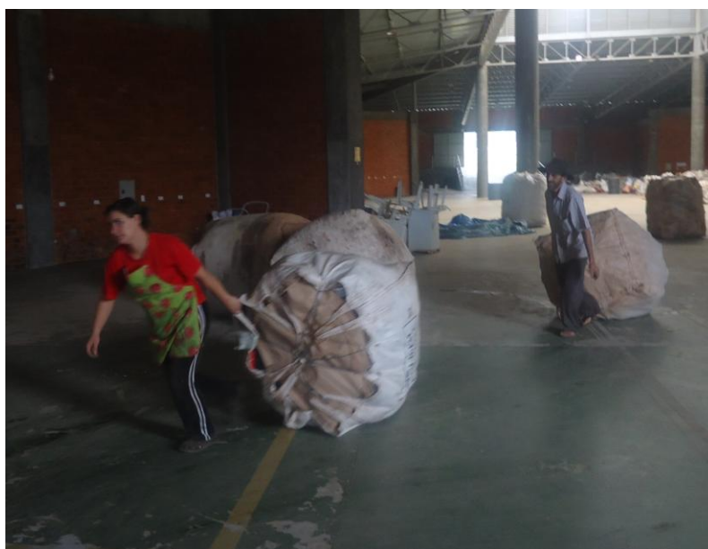
Figura 13 – Bag's sendo arrastados pelos trabalhadores para armazenamento