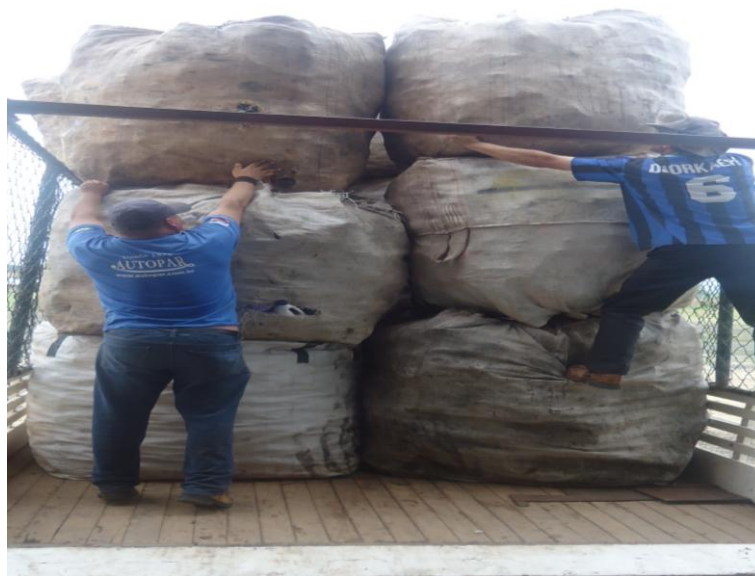
Figura 17 – Bag's sendo carregados no caminhão