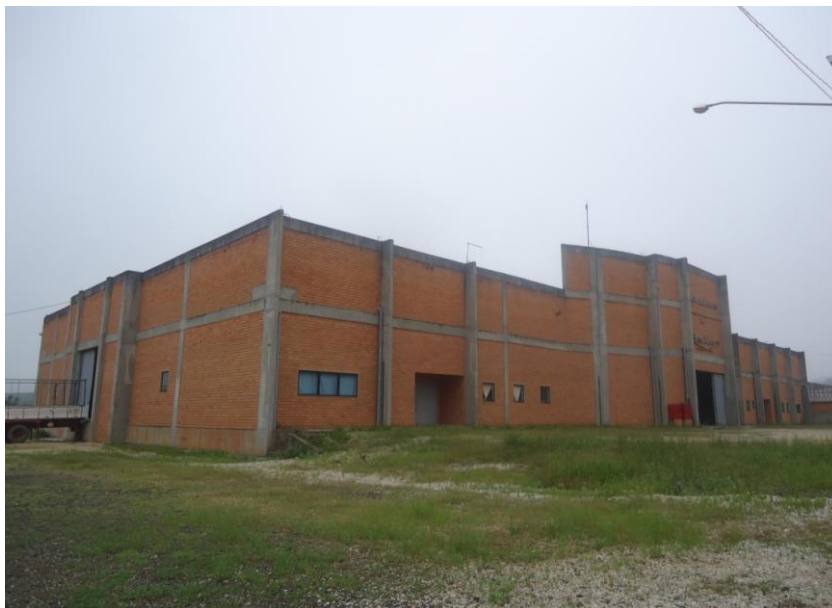
Figura 1 – Vista externa do barracão utilizado pela ACMRBN