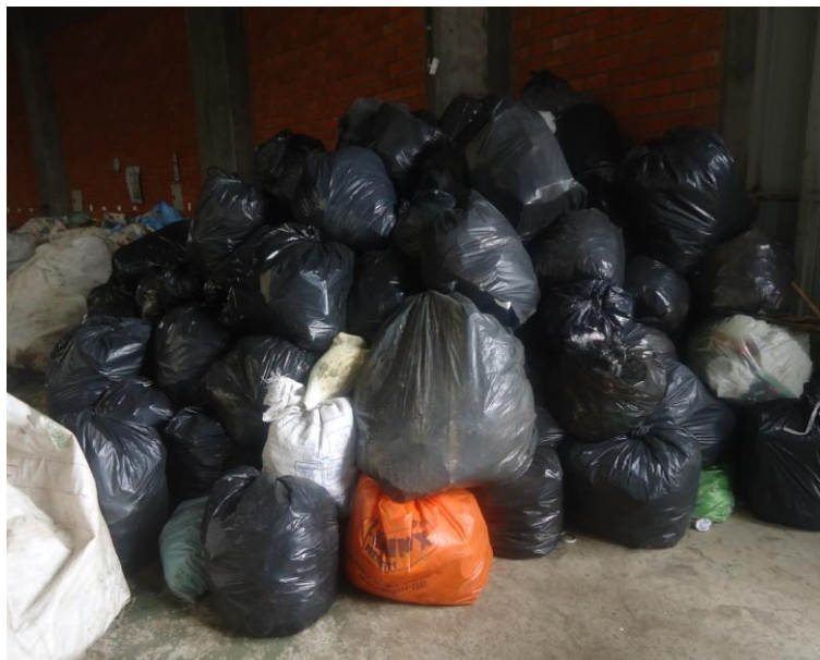
Figura 9 – Rejeitos armazenados para destinação ao aterro sanitário municipal

Verificou-se nesta etapa que os trabalhadores não utilizavam os Equipamentos de Proteção Individual – EPI's conforme estabelece a Norma Regulamentadora (NR) número 6. A disposição dos materiais no chão ocasiona postura desconfortável e não segue os critérios de Ergonomia estabelecidos na NR 17. Juntamente com os resíduos recicláveis, foram identificados resíduos orgânicos em decomposição, agulhas e seringas, cacos de vidro, lâmpadas fluorescentes, fraldas descartáveis e animais mortos conforme ilustrado na Figura 10.