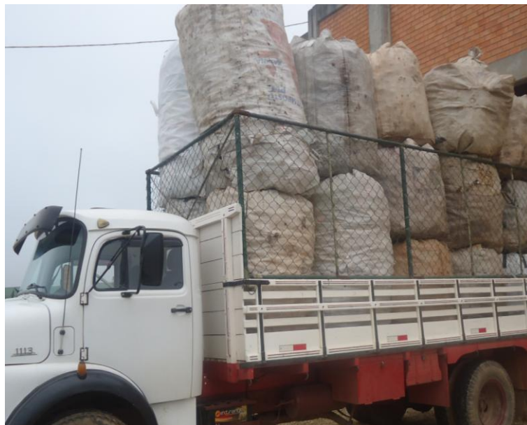
Figura 18 – Caminhão carregado com os Bag's Fonte: A autora, 2014.

Verificou-se nas etapas supracitadas a não utilização de EPI's, grande esforço físico, pois alguns bag's chegam a pesar até 180 Kg, e postura desconfortável.