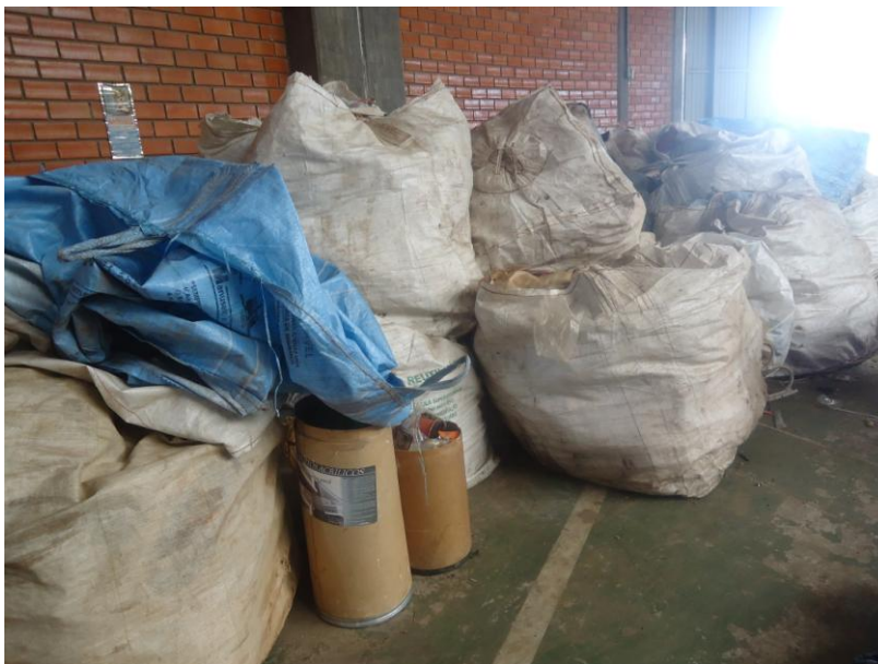
Figura 5 – Acondicionamento dos bag's trazidos pelo caminhão da coleta seletiva

Os trabalhadores retiram os sacos e sacolas de resíduos de dentro dos bag's e os espalham no chão para fazer a triagem. Da Figura 6 a Figura 8 é ilustrado os associados fazendo a separação dos materiais. Os rejeitos e resíduos que não possuem mercado para comercialização, são colocados em sacos de lixo preto e destinados ao aterro sanitário municipal conforme ilustrado na Figura 9.