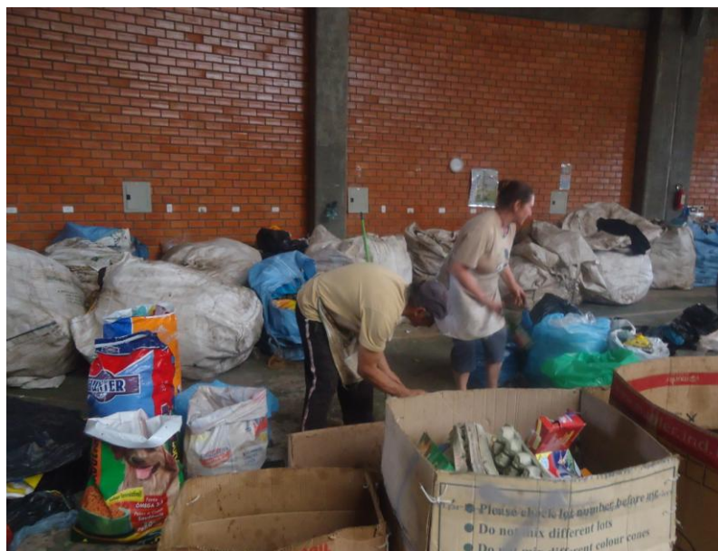
Figura 7 – Associados realizando a triagem dos resíduos