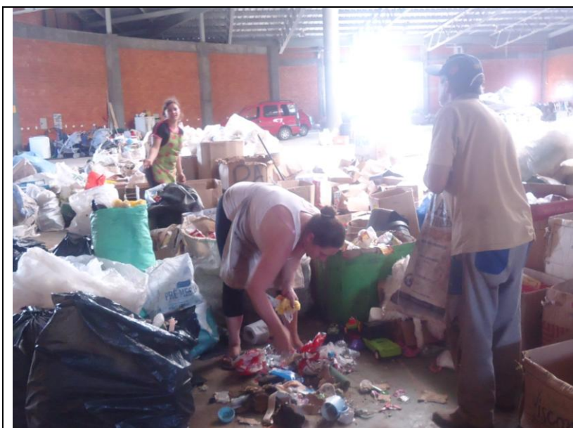
Figura 6 – Associados realizando a triagem dos resíduos

Os trabalhadores retiram os sacos e sacolas de resíduos de dentro dos bag's e os espalham no chão para fazer a triagem. Da Figura 6 a Figura 8 é ilustrado os associados fazendo a separação dos materiais. Os rejeitos e resíduos que não possuem mercado para comercialização, são colocados em sacos de lixo preto e destinados ao aterro sanitário municipal conforme ilustrado na Figura 9.