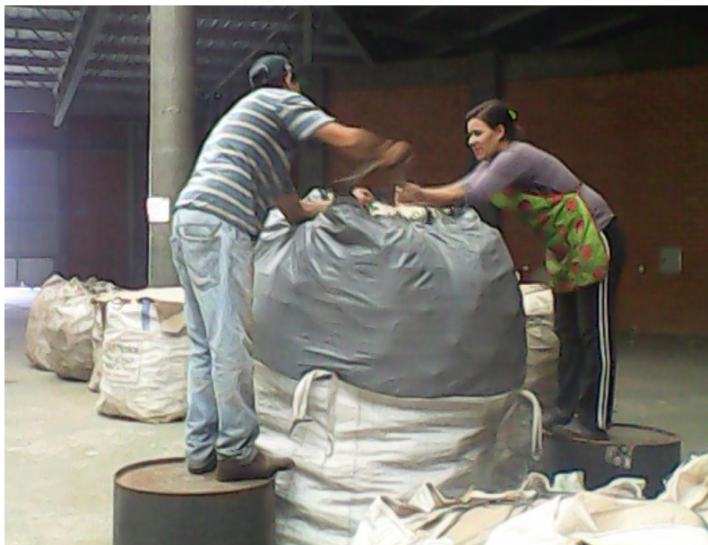
Figura 12 – Trabalhadores realizando o ensacamento do material segregado