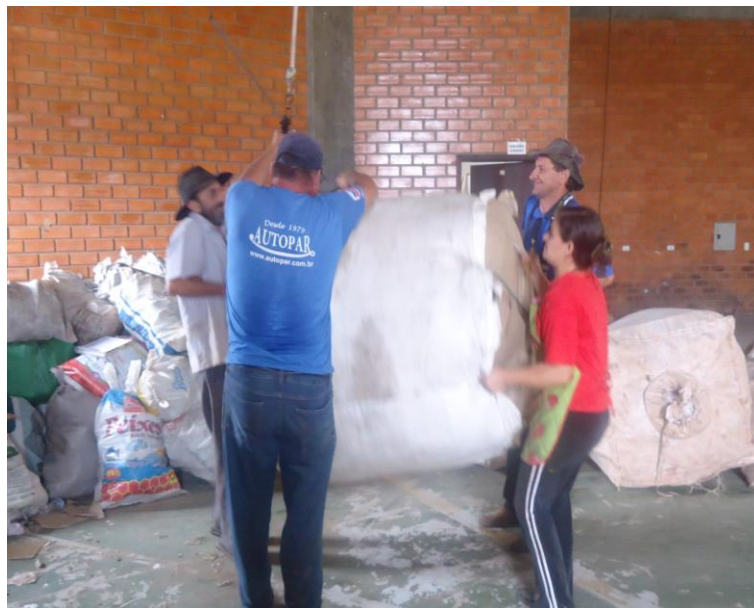
Figura 16 – Associados pendurando o Bag na balança suspensa para fazer a pesagem