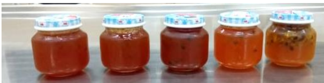
Figura 3 – Formulações F1 – pectina industrial; F2, F3, F4 e F5 – (0%, 10%, 20% e 30% de polpa de maracujá respectivamente).

Foram desenvolvidas cinco formulações (Tabela 1) (F1, F2, F3, F4 e F5), alterando-se a quantidade em relação ao suco de maracujá, e substituindo a pectina comercial por albedo de maracujá. Na Figura 3 encontram-se as geleias de cada formulação.