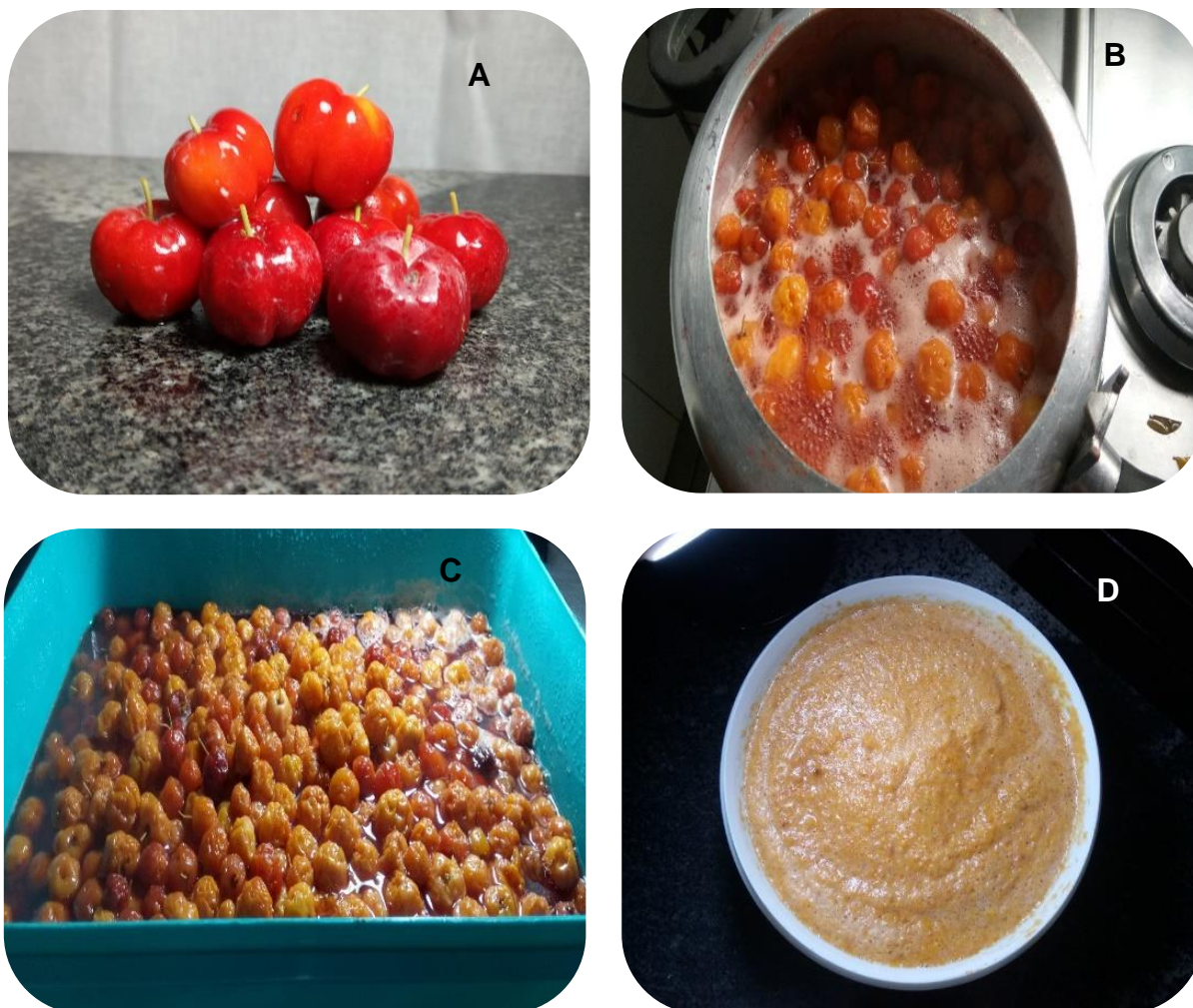
Figura 5 – Preparação da polpa de acerola. A- Acerola, B- Acerola cocção para retirada da polpa, C- Acerola indo para resfriamento, D- Polpa da acerola.

Os frutos inteiros (Figura 5A) foram selecionados e lavados com água abundante, e depois imersos em solução de hipoclorito de sódio a 200 ppm, por 20 minutos (Figura 5B), para remover os micro-organismos dos frutos. A acerola inteira foi levada para o cozimento para a retirada da polpa (Figura 5C), depois foi prensada em uma peneira de inox para separar a polpa da semente (Figura 5D).