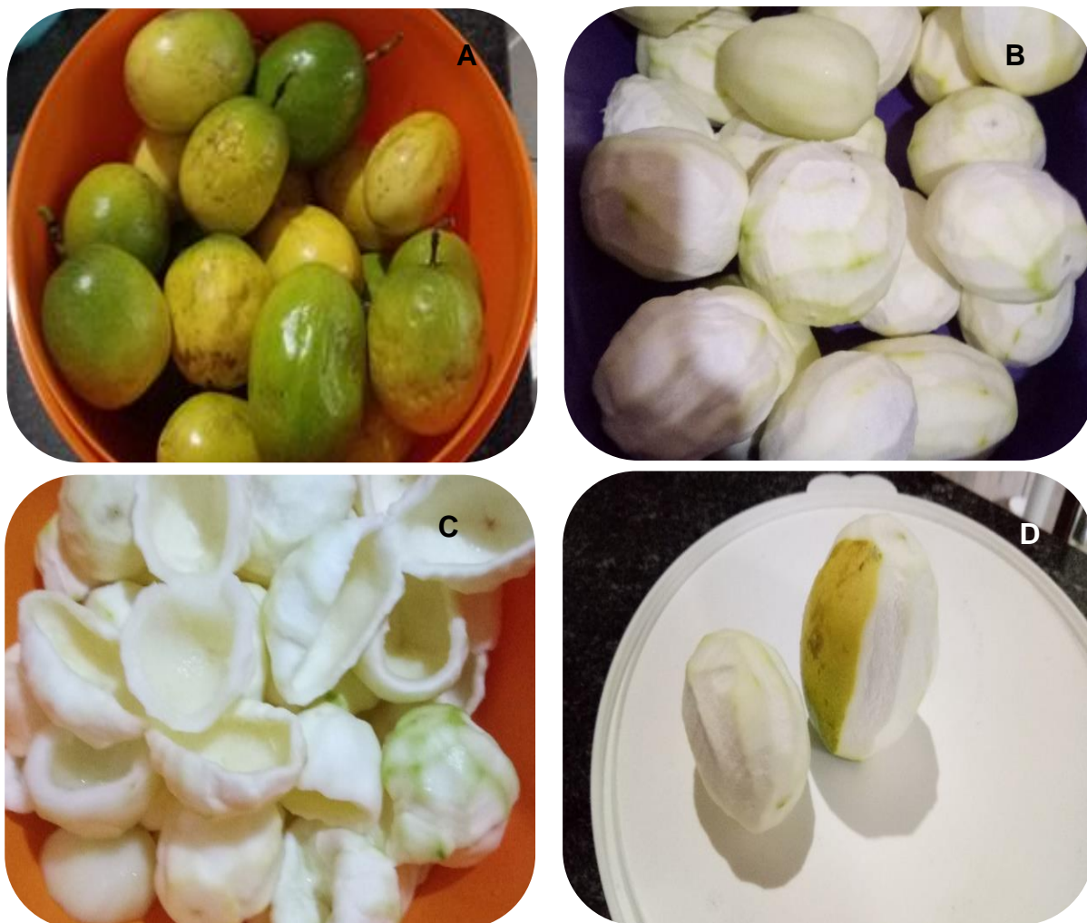
Figura 4 – Preparação do maracujá para retirada do albedo: A- Maracujá, B- Maracujá descascado, C- Maracujá totalmente descascado, D- Albedo.