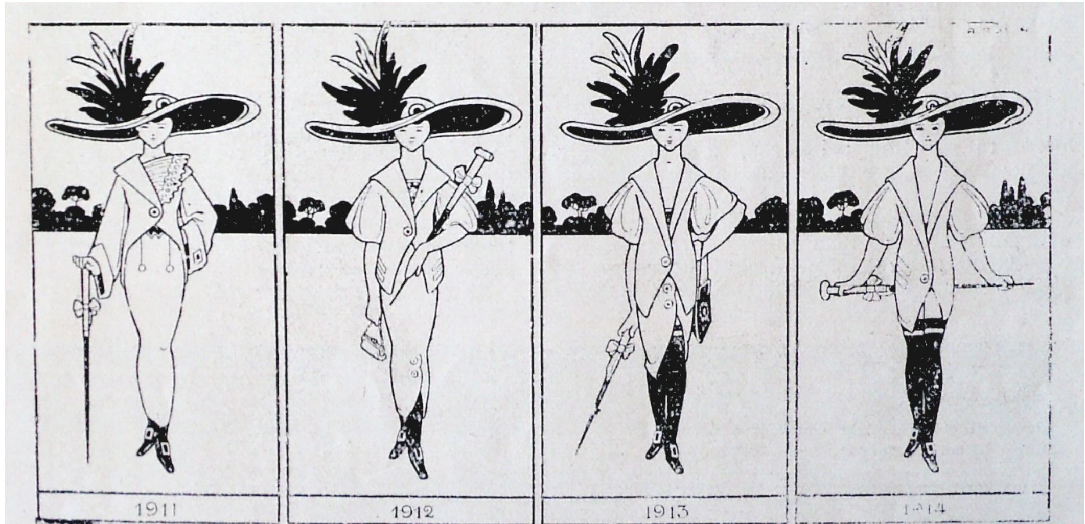
A evolução da saia