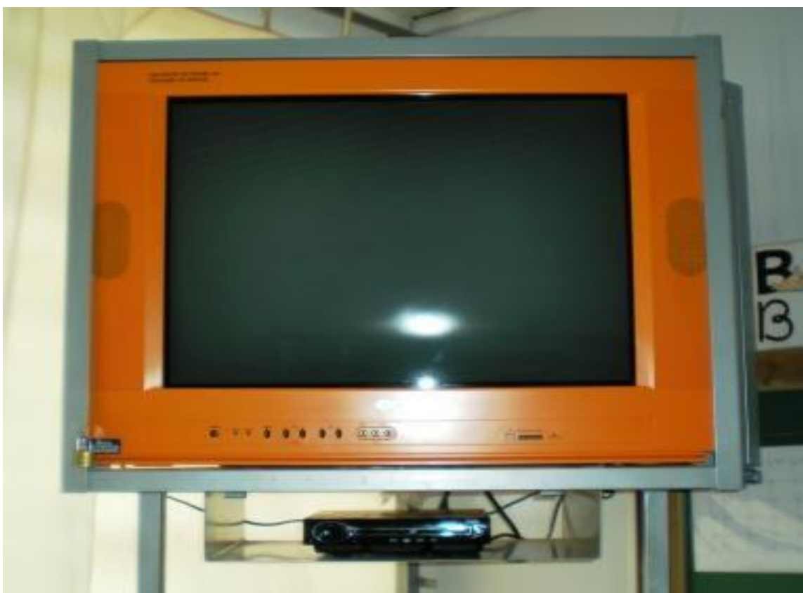
Fotografia 3 – Possibilidade de Utilização do DVD para reprodução de vídeos na Televisão Multimídia