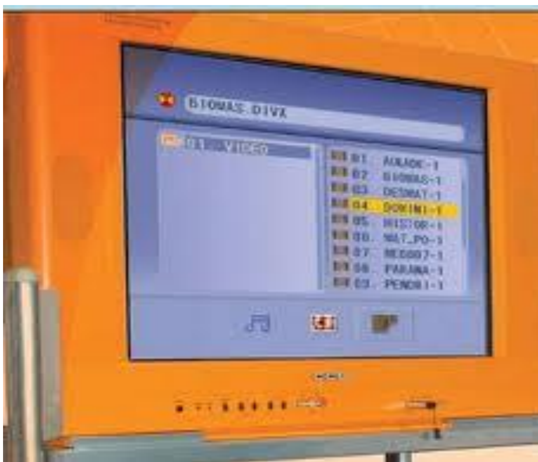
Fotografia 2 – Utilização do Pendrive para reprodução de vídeos e textos na Televisão Multimídia