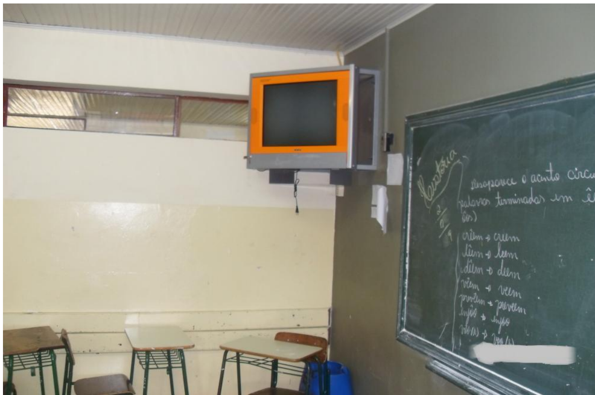
Fotografia 1 – Posição da Televisão Multimídia na Sala de Aula