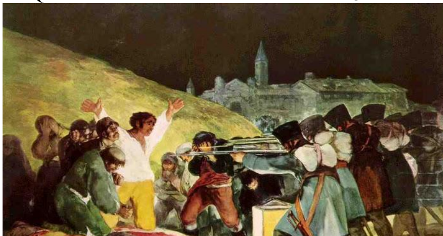
FIGURA 1 – QUADRO DE GOYA “O FUZILAMENTO DE 3 DE MAIO DE 1808”

Explorar, ainda, o Quadro de Goya. Essa obra foi uma das inspirações de Antunes para a composição da música, problematizando representações de violência e conflito.