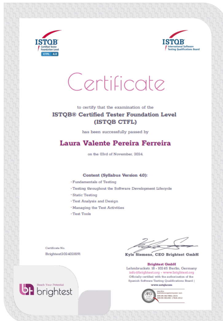
Figura 3 – Certificação CTFL.