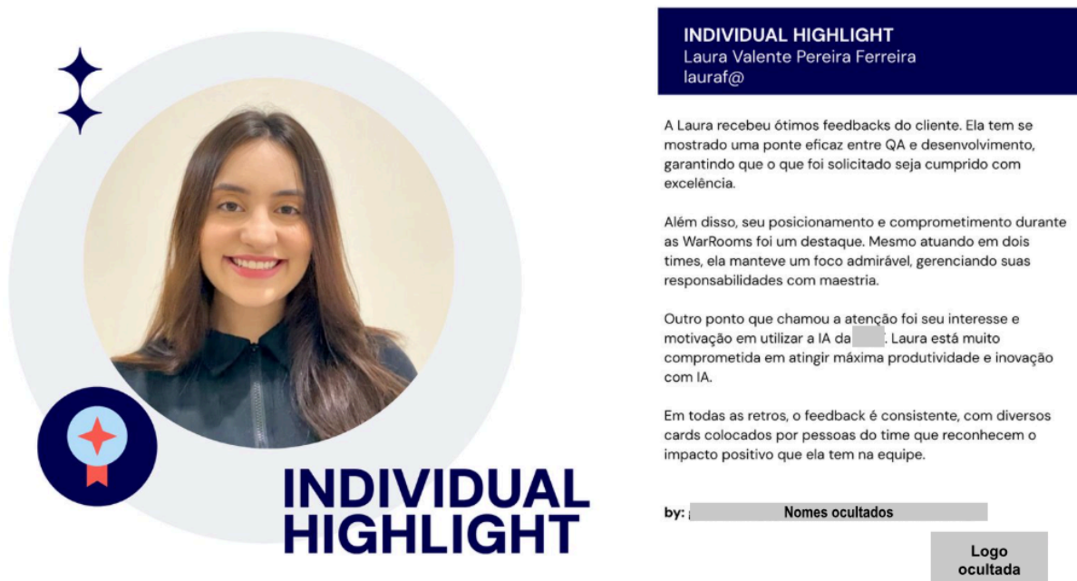
Figura 2 – Reconhecimento

um marco reconhecido internacionalmente que valida os conhecimentos fundamentais em testes de software e atesta sua competência para atuar na área de Quality Assurance. Essa certificação é de extrema importância, pois demonstra o comprometimento com a qualidade, a padronização das práticas de testes e a busca contínua por excelência profissional.