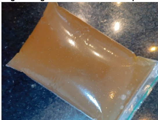
Figura 2. Carbogel energético à base de banana produzido no estudo

A Figura 2 apresenta o resultado final da produção do carbogel energético à base de banana.