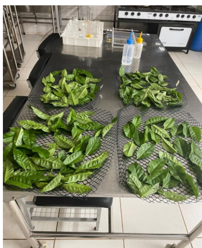
Figura 3 – Folhas de ora-pro-nóbis sendo preparadas para secagem

Após a colheita, as folhas foram submetidas a um processo de seleção, separação de impurezas ou folhas estragadas e sanitização (solução de hipoclorito de sódio a 200 ppm por 15 min), seguido por um enxágue em água limpa para remoção dos resíduos do sanitizante. As folhas sanitizadas foram então submetidas à secagem em estufa a uma temperatura controlada de 55 °C, por um período aproximado de 24 horas (Figura 3).