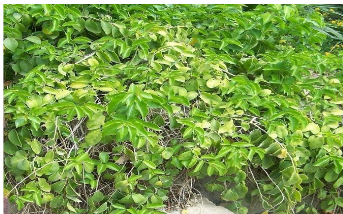
Figura 1 - Ora-pro-nóbis ( Pereskia aculeata Miller)

A ora-pro-nóbis ( Pereskia aculeata Miller) (Figura 1) é uma planta nativa da região tropical das Américas, pertencente à família Cactaceae , conhecida por suas propriedades nutricionais e terapêuticas. Tradicionalmente consumida em diversas partes do Brasil, especialmente em Minas Gerais, a planta tem atraído a atenção de pesquisadores devido ao seu elevado valor nutricional e potencial para o desenvolvimento de alimentos mais saudáveis e sustentáveis. Suas folhas são particularmente ricas em proteínas, fibras, vitaminas e minerais, tornando-a uma opção interessante para complementar a alimentação humana, especialmente em comunidades rurais ou em situações de insegurança alimentar (Bach; Santos, 2021).