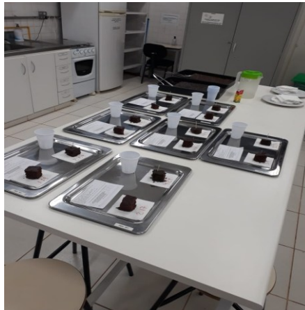
Figura 6 – Mesa de preparo do teste de aceitação sensorial