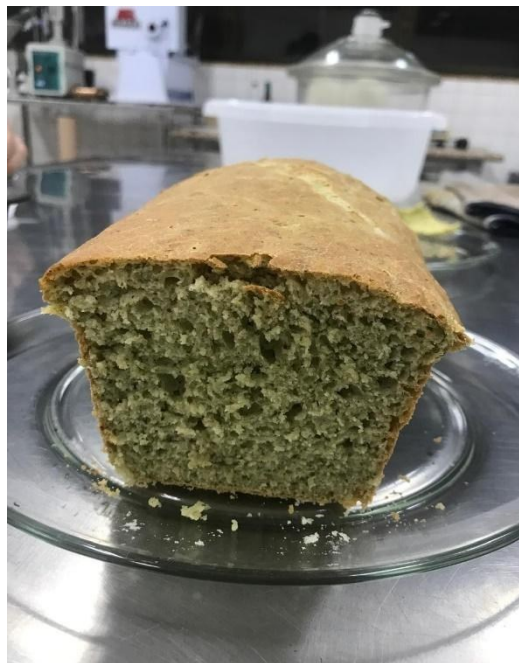
Figura 2 - Pão de farinha de ora-pro-nóbis

produtos com ora-pro-nóbis são bem aceitos, o que abre novas possibilidades para a incorporação da planta na indústria alimentícia (Lise, 2021).