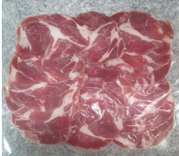
Figura 7 - Copa Fatiada após 35 dias de maturação