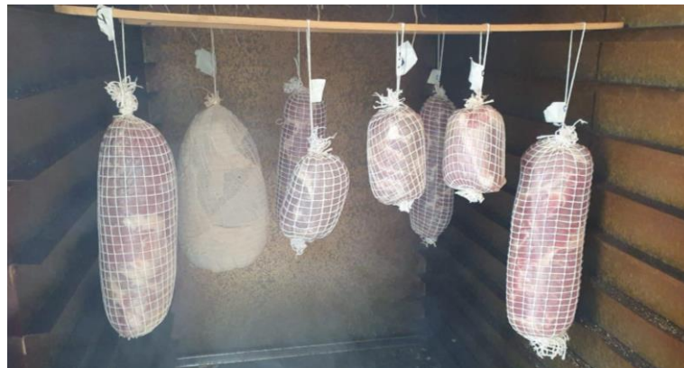
Figura 5 - Copas em processo de defumação

O aroma intenso proporcionado pelos óleos voláteis sugere a existência de outras abordagens para intensificar o sabor defumado. Uma alternativa viável teria sido a inclusão de fumaça em pó ou fumaça líquida durante a fase de cura, incorporando esses componentes à mistura de especiarias utilizada durante a etapa de condimentação. Essas estratégias destacam a preocupação com a obtenção de um produto final que não apenas atenda aos padrões de qualidade, mas também ofereça um sabor e aroma distintos e atraentes para os consumidores.