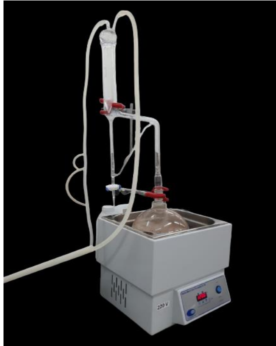
Figura 2 - Aparelho de Clevenger utilizado para extrações do óleo volátil de noz-moscada