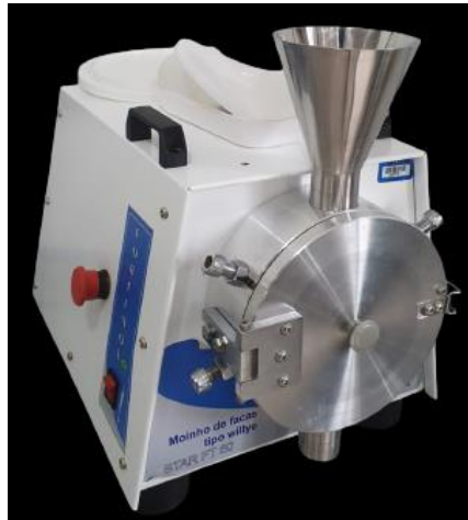
Figura 1 – Foto do moinho de facas tipo willye Star FT 50

Para a obtenção do óleo volátil, as sementes de noz-moscada foram adquiridas no comércio local de Francisco Beltrão - PR. O total de 1.154 g de noz-moscada foram trituradas em moinho de facas tipo Willye Star FT 50 (Figura 1), em lotes de pequena quantidade para não acontecer pré-extração devido ao atrito das facas causando o aumento da temperatura que favorece a difusão do óleo de dentro da partícula sólida. A obtenção de partículas de menor tamanho favorece o contato do solvente por aumento de superfície de troca mássica, melhorando, assim, o processo de extração. Após a moagem, foram armazenadas em embalagem de polietileno a vácuo e sob refrigeração até a extração.