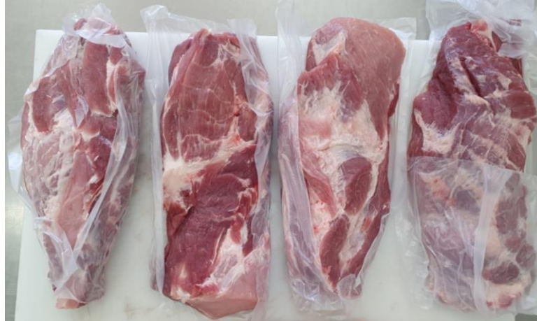
Figura 3 - Peças com peso médio de 1.000 g prontas para início da preparação das copas

anomalias que pudessem ser classificadas como PSE ( Pale, Soft, Exudative ) ou DFD ( Dark, Firm, Dry ). As peças utilizadas atenderam a esse requisito, apresentando níveis de pH situados entre 5,8 e 5,9, o que as tornou totalmente aptas para a produção do produto.