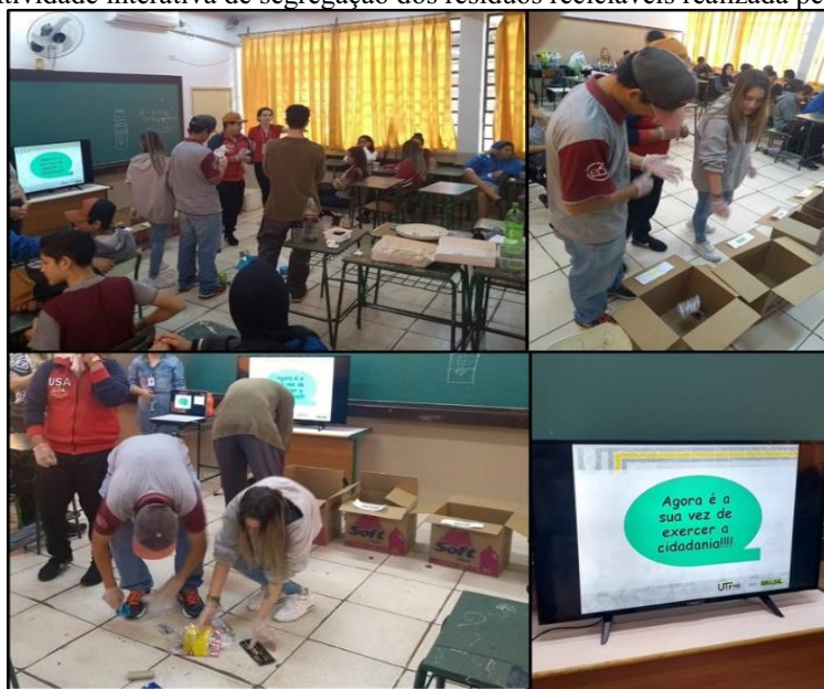
Figura 2 – Atividade interativa de segregação dos resíduos recicláveis realizada pelos estudantes

caixa posso jogar o guardanapo sujo de gordura?” , então foi explicado que poderia ser descartado na caixa de orgânico, mas também na caixa de papel, pois mesmo que sujos com a gordura não inviabilizam a reciclagem. Destacamos que nos casos de rejeitos como é o caso de papel higiênico e fraldas, seu descarte não pode ser realizado em resíduos recicláveis devido aos riscos biológicos que contém estes tipos de resíduos.