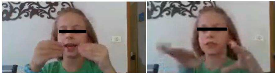
Figura 02 - aluna representando metade do pacote

representação fracionária dos números racionais e, conseqüentemente, está na base do desenvolvimento/mobilização do Raciocínio Proporcional” (CYRINO et al. , 2014, p. 52).