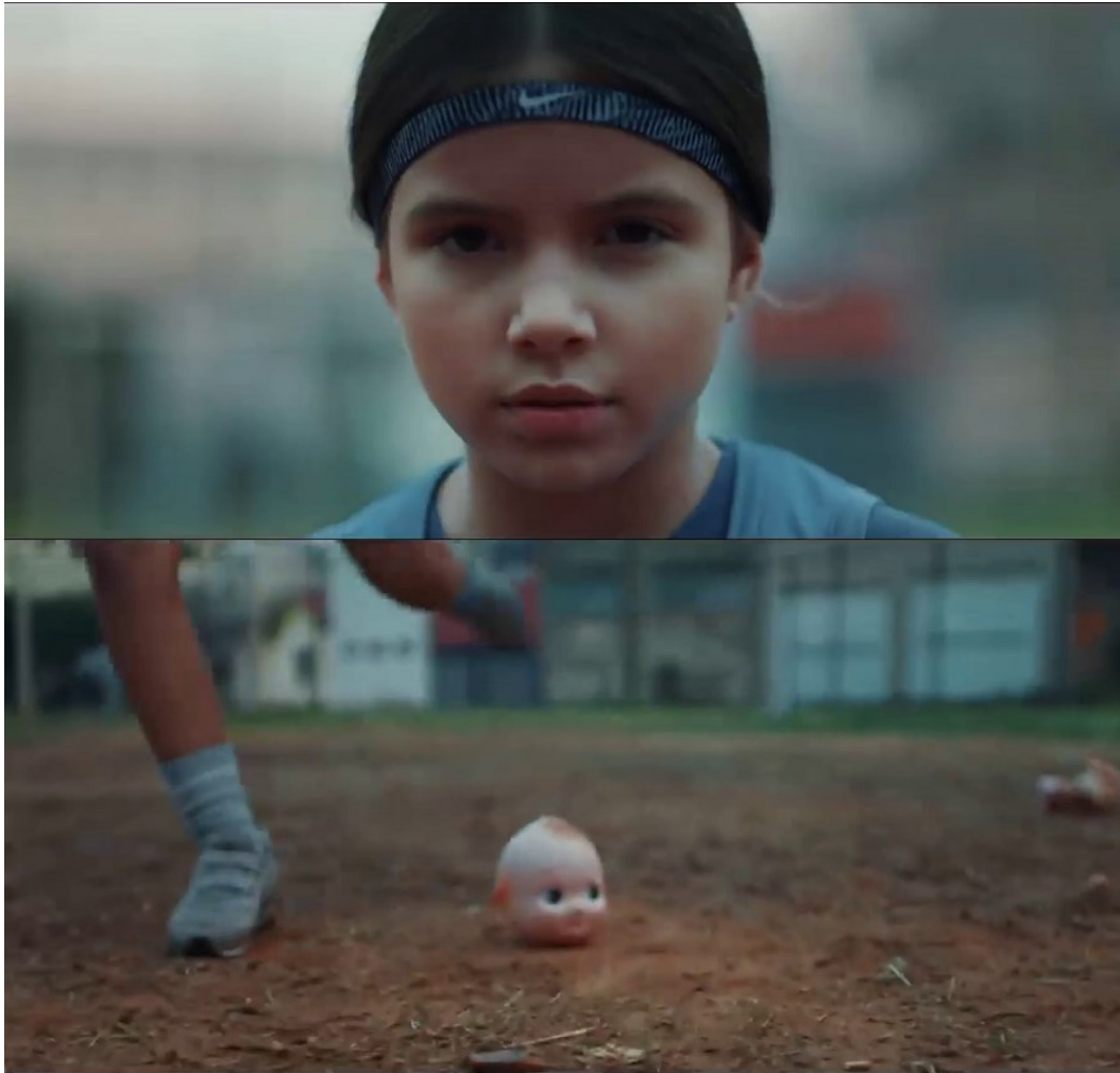
Imagem 6 – SD7