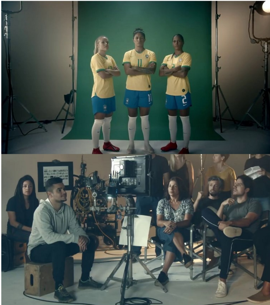
Imagem 11 – SD17