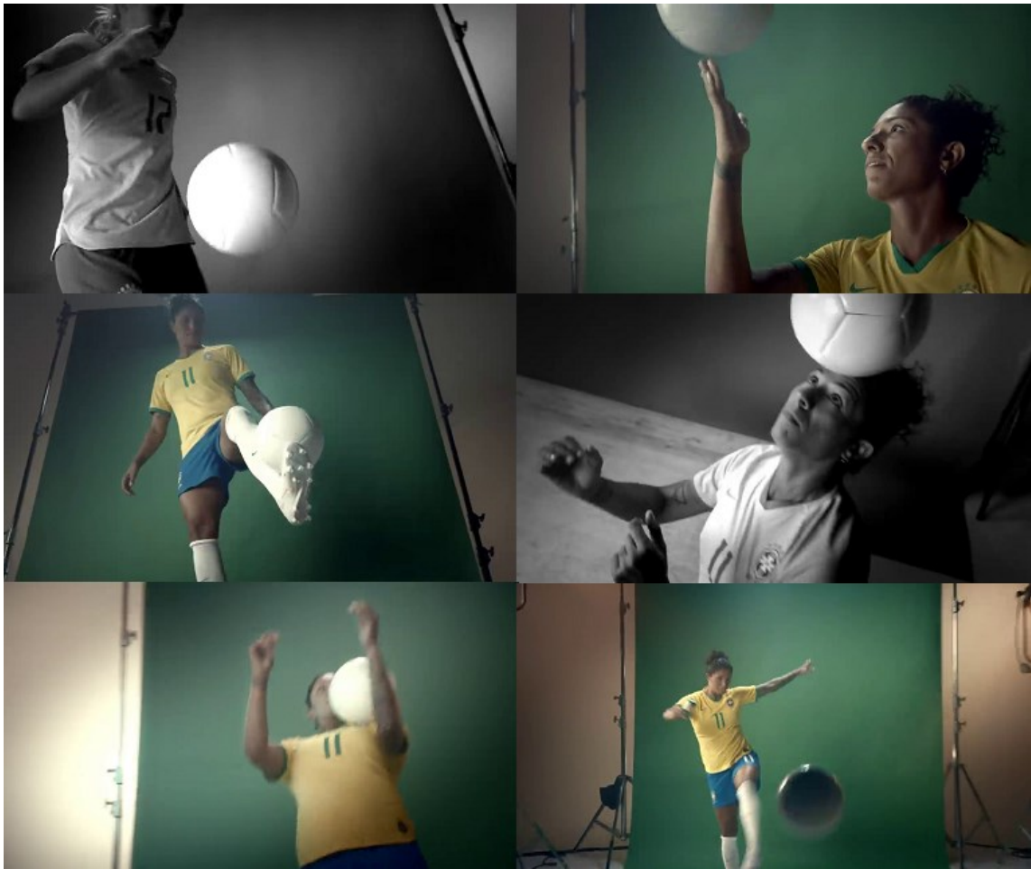
Imagem 13 – SD21