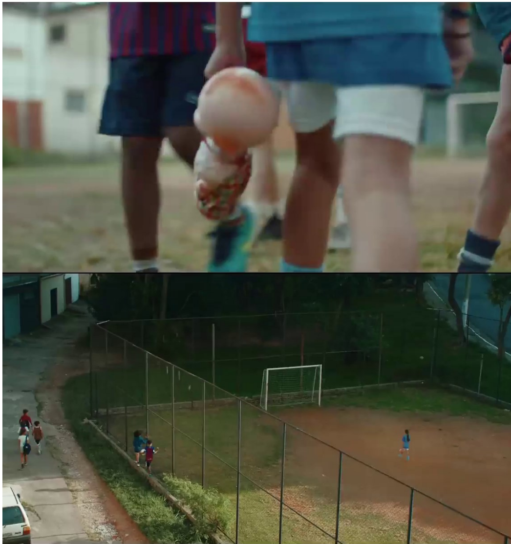
Imagem 5 – SD6