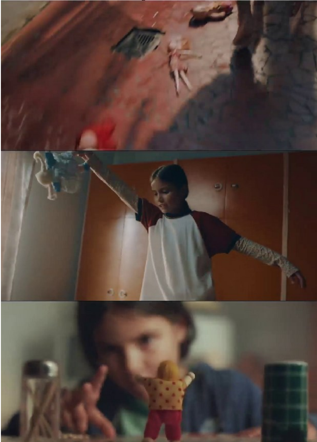
Imagem 1 – SD1