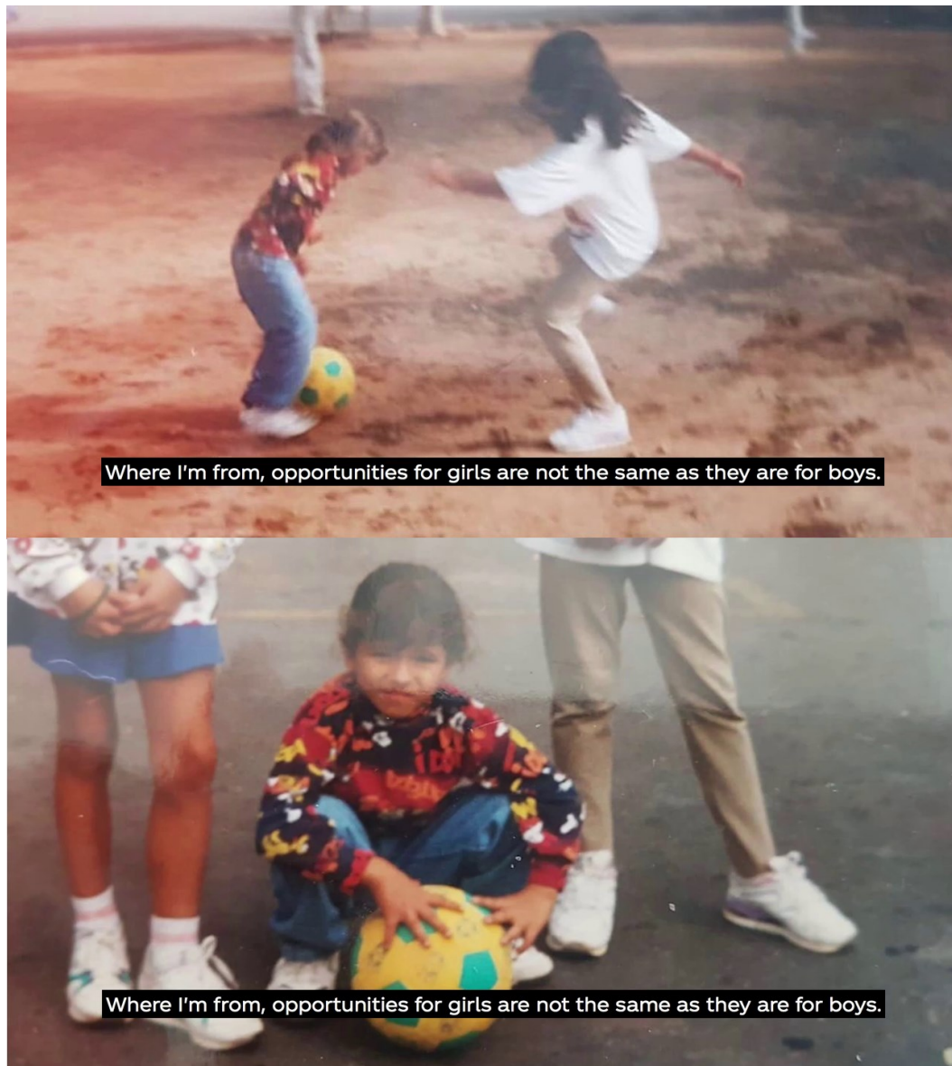
Imagem 8 – SD10