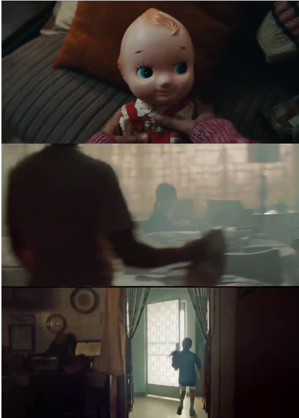
Imagem 4 – SD5