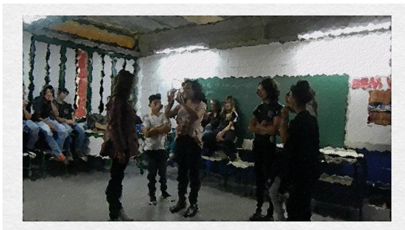
A professora “A” orienta os alunos do centro da sala sobre a dança a ser reproduzida

No terceiro momento, a professora “A” dá instruções aos alunos posicionados no centro da sala de aula. Essas instruções dizem respeito à maneira como os alunos devem reproduzir o vídeo e a lateralidade na dança (esquerda e direita). Todos os alunos observam a explicação da professora.