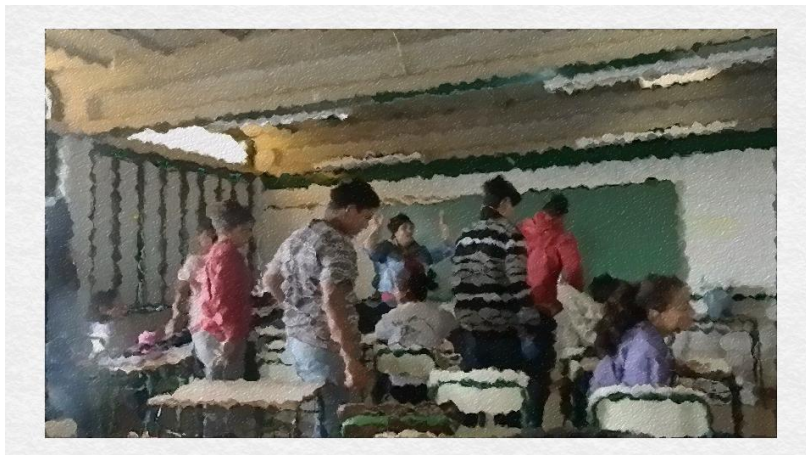
Momento em que o “sinal bate” e os alunos se levantam para sair da sala de aula

No momento desse fotograma, “o sinal bate” para o intervalo, a professora “B” se justifica dizendo que gostaria de fazer uma prática mas não houve tempo disponível. A professora “B” agradece e os alunos saem da sala de aula.