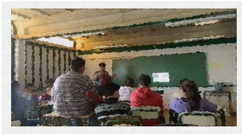
A professora “B” mostra imagens das assemblagens projetadas no quadro negro

Nesse momento a professora “B” estava na frente da sala de aula mostrando exemplos de imagens de assemblagem projetados através do multimídia no quadro negro, como podemos observar nos fotogramas.