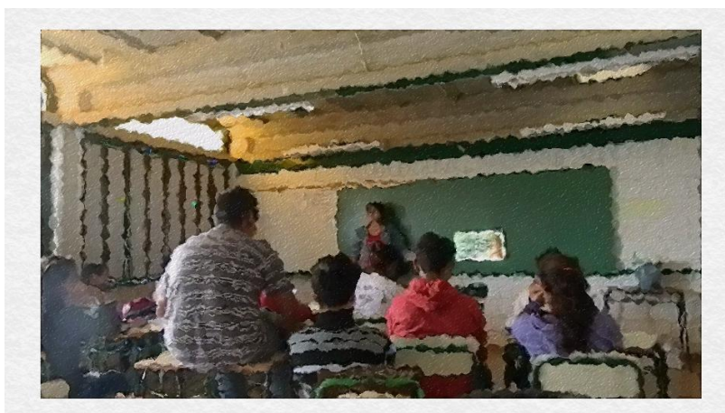
A professora “B” explica o conteúdo de assemblagem enquanto os alunos observam as imagens

Nesse momento a professora “B” estava na frente da sala de aula mostrando exemplos de imagens de assemblagem projetados através do multimídia no quadro negro, como podemos observar nos fotogramas.