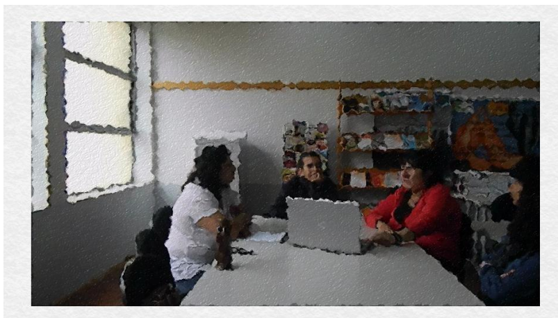
Sessão de autoconfrontação cruzada 2

Na situação de autoconfrontação cruzada 2 a professora “B” observa e comenta sobre o trecho de aula da sua colega (linhas 29-36).