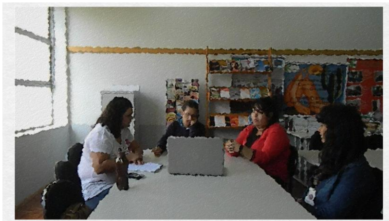
Sessão de autoconfrontação cruzada 1

Ao descrever o trecho de aula da professora “B”, a professora “A” também comenta sobre a organização dos alunos.