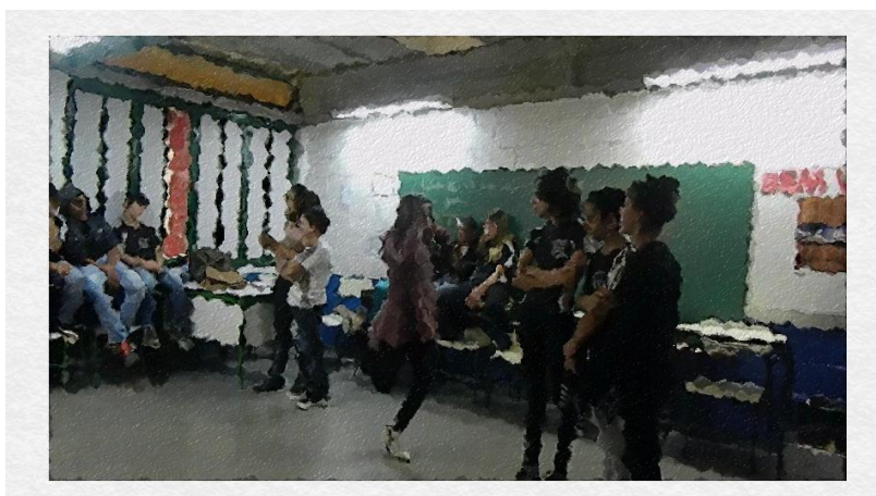
A professora “A” está dando instruções para os alunos que estão sentados observando

Nesse primeiro momento, a professora “A” demonstra certa dificuldade em mexer no controle da TV. Enquanto os alunos posicionados no centro da sala aguardam as instruções da professora, o restante dos alunos observa, sentados nas carteiras em volta da sala de aula.