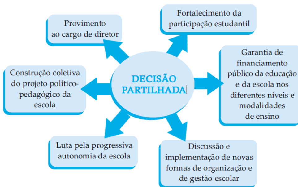
Figura 2 – Aspectos essenciais em uma escola democrática

Para que uma escola seja realmente considerada democrática, segundo as reflexões acima, as mudanças já realizadas em documentos, teorias e discursos somente se aplicarão a realidade das instituições de ensino a partir do momento em que houver a mudança de mentalidade das pessoas que fazem parte da escola. No entanto algumas ações são necessárias a essa mudança. Dourado (2005) diz que o modelo de gestão adotado pelos sistemas públicos conserva, ainda hoje, características de um modelo centralizador. Abaixo será apresentada a figura 1, onde o MEC (2004) salienta algumas ações necessárias a implantação da escola democrática e da descentralização de poder nos gestores e professores.