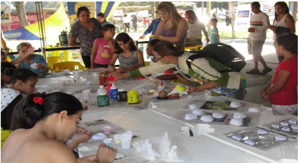
Fotografia 2: Oficina de artesanato, realizada durante a Ação Juventude