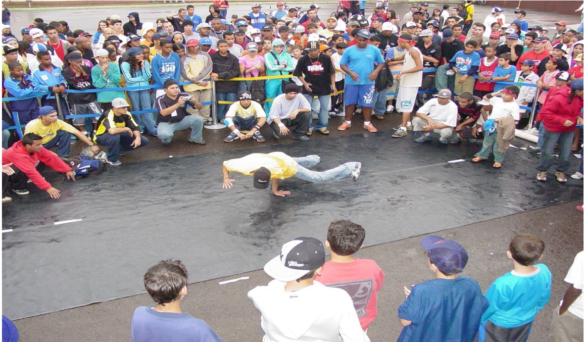
Fotografia 1: Atividade da Tenda Hip-Hop em Ação, durante a Ação Juventude