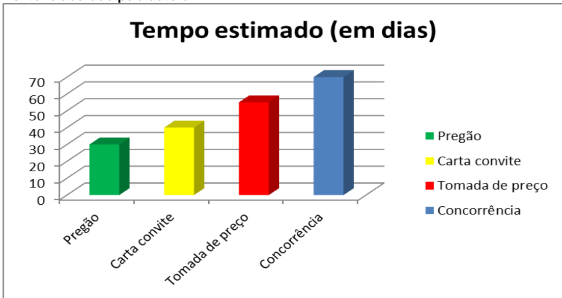
Gráfico 1: Tempo estimado (em dias)

O gráfico tempo estimado (em dias) representa a análise feita das licitações realizadas no exercício de 2011, demonstrando a vantagem do Pregão em relação às modalidades Convite, Tomada de Preços e Concorrência Pública.