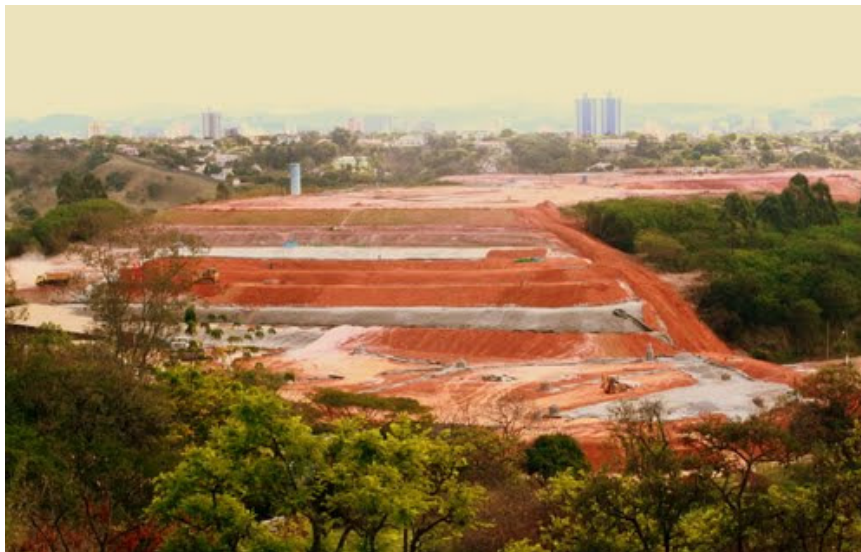
Figura 3 - Vista da ETRS mantida pela Empresa A

A ETRS ilustrada acima recebe em grande parte resíduos de natureza orgânica oriundos de todas as regiões da cidade. Por questões que envolvem a falta de infra-estrutura e recursos financeiros, a empresa A não realiza o procedimento de coleta e descarte de RCC, sendo esse tipo de serviço responsabilidade da empresa B, citada adiante. Apenas é de responsabilidade da empresa A o gerenciamento de resíduos sólidos orgânicos, hospitalares e recicláveis, previstos em contrato firmado com o município.