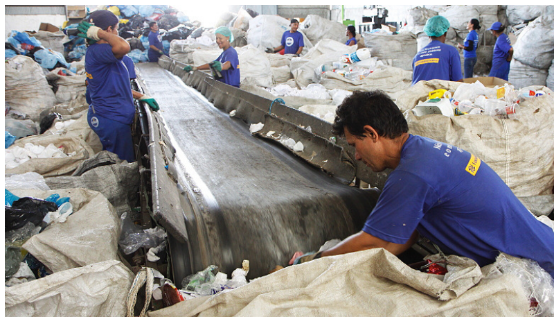
Figura 4 - Cooperativa Futura Fonte: SÃO JOSÉ DOS CAMPOS (2013)

Os catadores foram cadastrados e inseridos no Projeto Reciclagem Cidadã, que teve seu início em 2005 (FERREIRA e MOREIRA, 2013). Dessa forma se deu início a Cooperativa Futura, que com apoio da Secretaria de Desenvolvimento Social, tornou possível o conhecimento das ações realizadas pelos catadores informais, que passaram a ter auxílio da Prefeitura Municipal com materiais específicos para coleta, uniformes e um espaço dedicado aos serviços de coleta e separação dos resíduos, ilustrados a seguir.