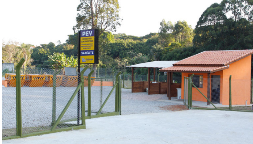
Figura 5 – PEV da região sul