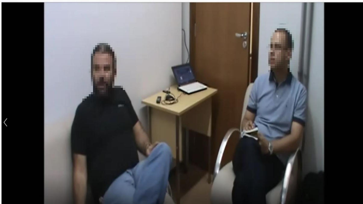
FIGURA 1 - CENA DE UMA AUTOCONFRONTAÇÃO