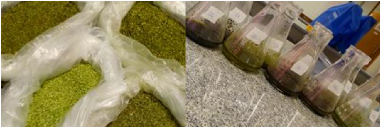
Figura 1 – Amostras de erva-mate e extratos obtidos após agitação.

Os extratos aquosos foram preparados com água quente a 70°C, com o objetivo de simular o consumo do tradicional chimarrão e os extratos etanólicos foram obtidos com etanol 40% (v/v), todos os extratos foram preparados em uma concentração de 50 mg·mL -1 . A Figura 1 apresenta diferentes amostras de erva-mate peneiradas e os extratos obtidos após a etapa de agitação.