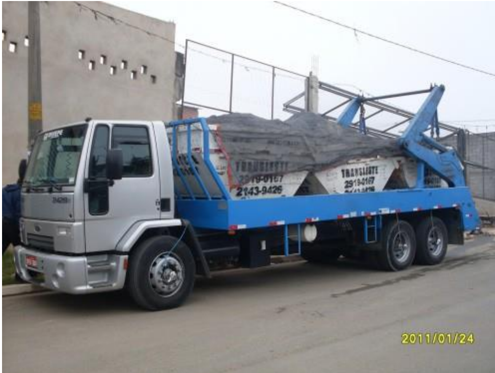
Figura 2 - Cobertura necessária para transporte de RCD