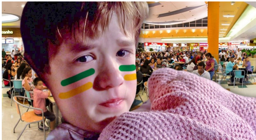
Figura 2: Imagem não verbal do texto

2 - Depois de realizar os questionamentos prévios e ouvir as conclusões dos alunos, mostrar a imagem para que estes tentem relacioná-la com o título.