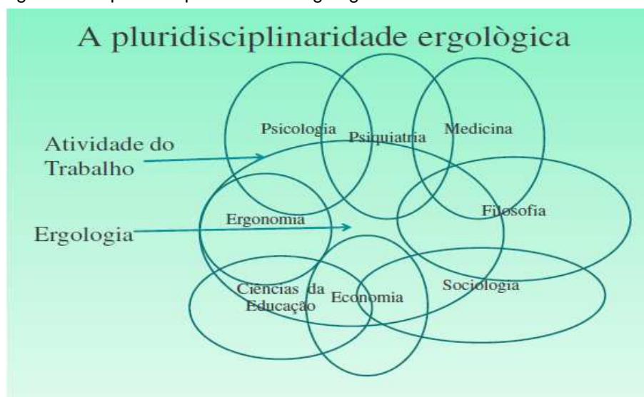
Figura 03- A pluridisciplinariedade Ergológica

Pierre Trinquet mostra como na Figura 03, que a ergologia, é um método pluridisciplinar inovador, permite abordar, com pertinência, a complexidade intrínseca da atividade humana do trabalho. Continua ainda que o intuito de considerar o trabalho real e o prescrito, convém colocar em dialética os saberes elaborados pelas disciplinas científicas concernentes (saberes constituídos) com os saberes adquiridos (saberes investidos).