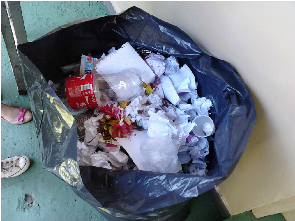
Figura 3. Fotografia tirada pelo aluno