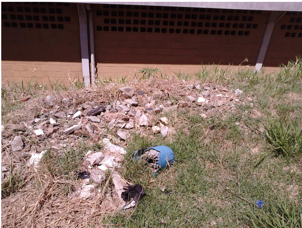
Figura 4. Fotografia tirada pelo aluno