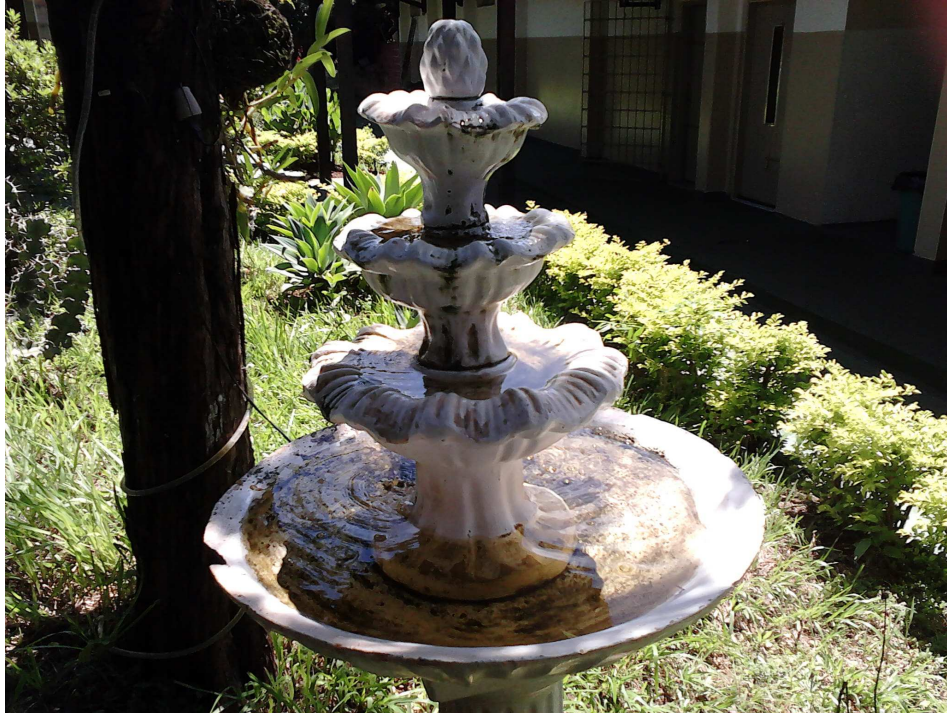
Figura 9.