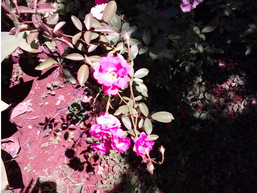
Figura 2.

Para Borges et alli (apud SPENCER, 1980)