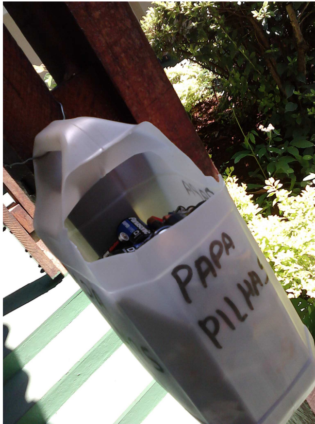
Figura 6.