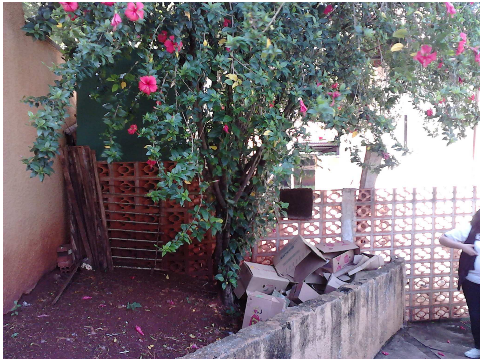
Figura 8.