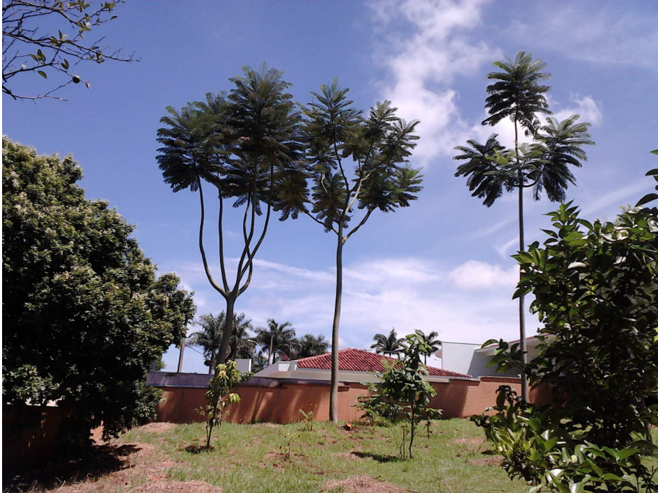
Figura 5.