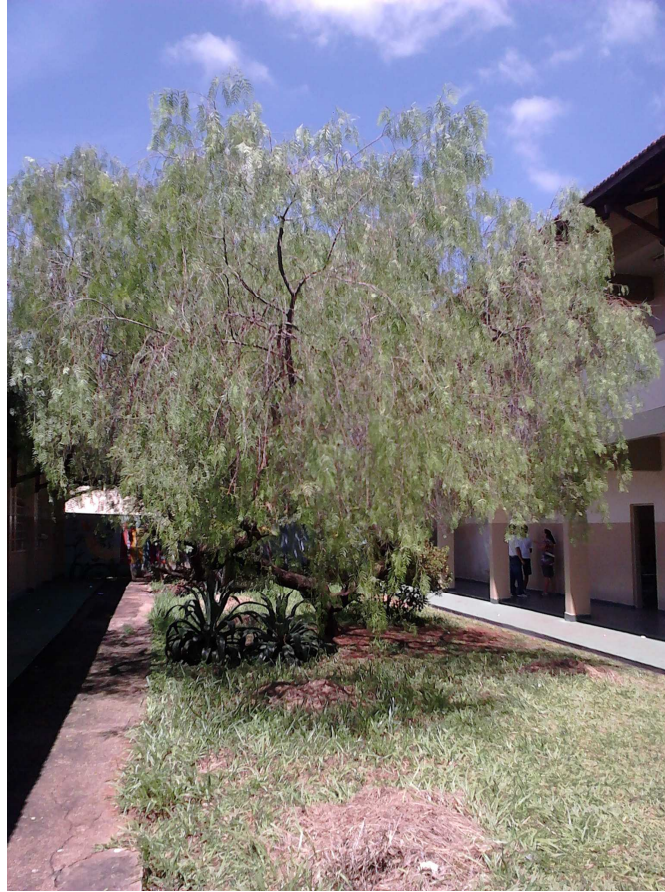
Figura 7. Fotografia retirada pelo aluno