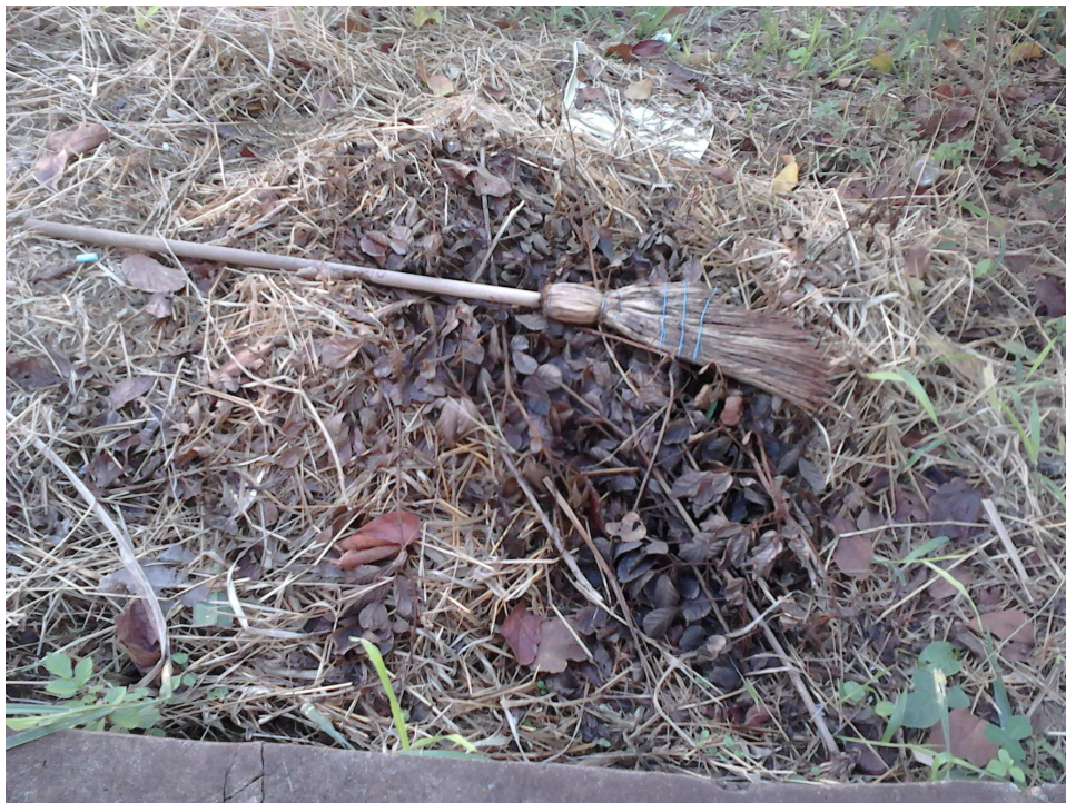
Figura 10. Fotografia retirada pelo aluno

O Currículo do Estado de São Paulo alerta: “As Ciências são, portanto, a base conceitual para intervenções práticas que podem ser destrutivas, [...] mas também promovem