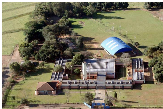
Figura 2: Foto aérea do Colégio Estadual de Goioerê.

Atualmente o colégio Estadual em que foi realizada a pesquisa, oferta o Ensino fundamental (6 a a 9 a séries), o Ensino Médio e Educação Profissional-Técnico em Informática Integrada em Técnica em Informática Subsequente e o