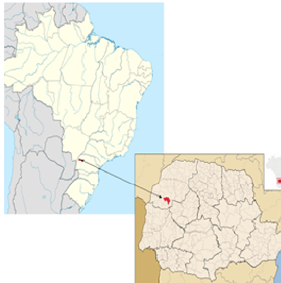
Figura 1 – Localização Geográfica do Município de Perobal

A figura 1 ilustra a localização do Município de Perobal- PR, dentro da região noroeste do Paraná.