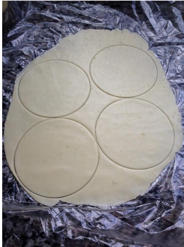
Figura 2: massa do pastel após ter sido esticada.