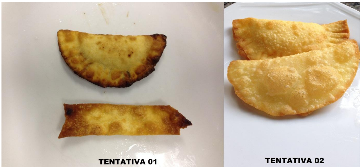
Figura 3: pastel frito. Fonte: autoria própria