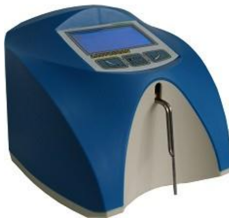
Figura 1 - Ultra-som Lactoscan SLP (Entelbra)